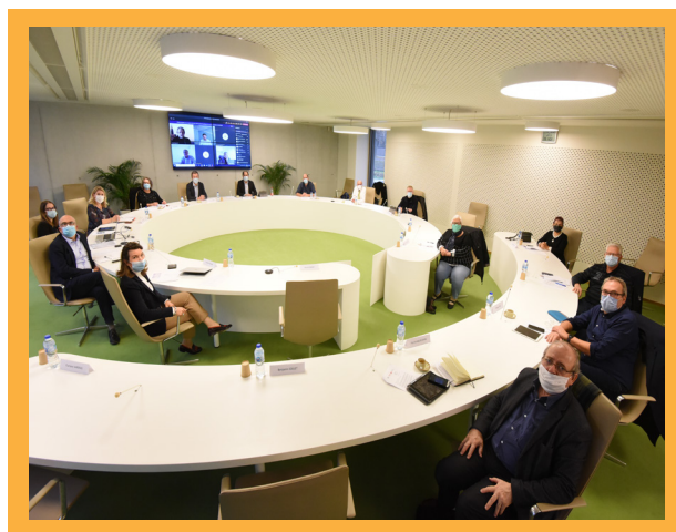
Séance inaugurale du Conseil de Surveillance d'emha ce jeudi 19 novembre