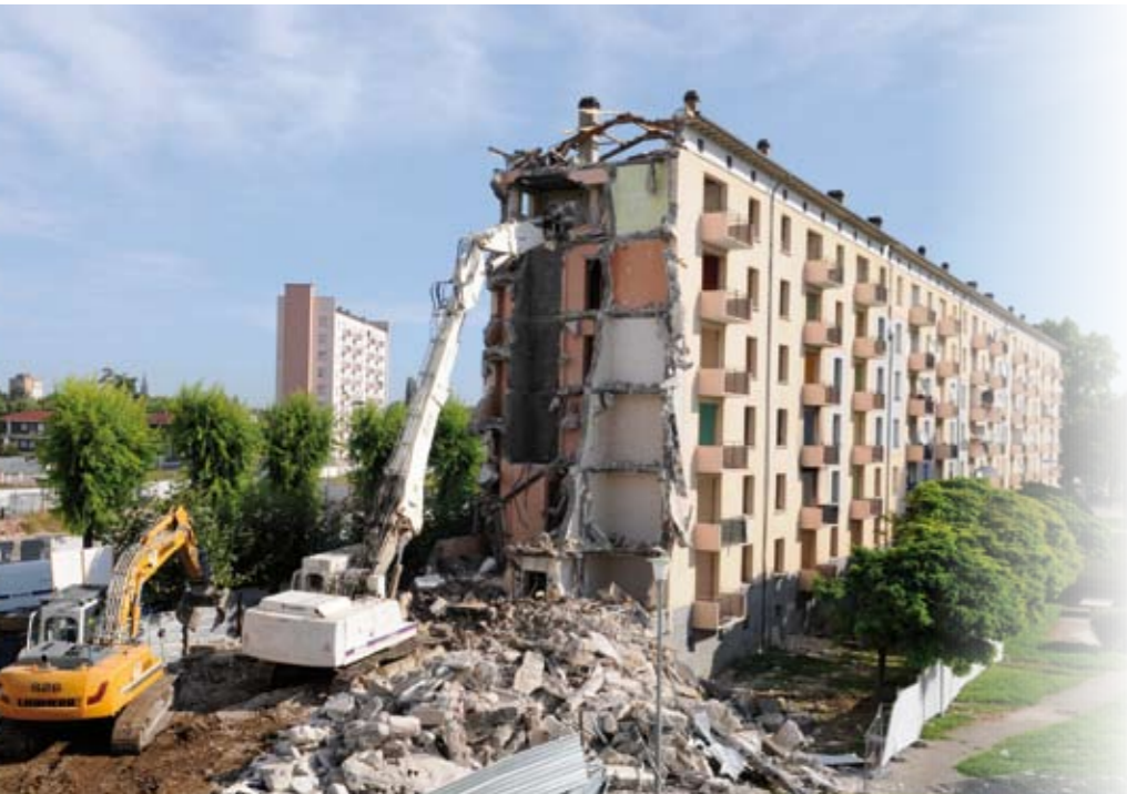
Le 11 rue Schulmeister en cours de démolition, au mois d'août.

Deux nouvelles démolitions, au cours du mois d'août, ont ouvert la deuxième phase du projet de rénovation urbaine de la Meinau. Deux des quelque 21 chantiers de CUS Habitat qui redessineront le quartier d'ici 2014.