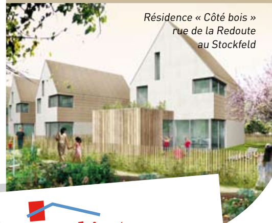
Résidence « Côté bois » rue de la Redoute au Stockfeld