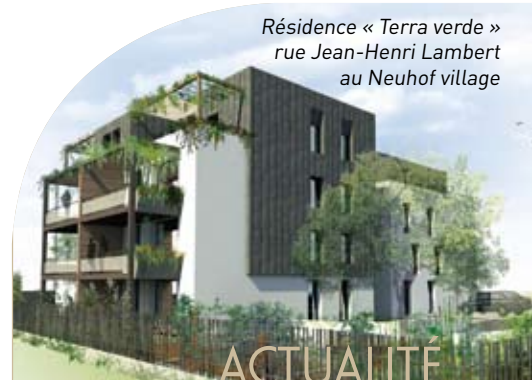
Résidence « Terra verde » rue Jean-Henri Lambert au Neuhof village

CUS Habitat adhère à Ecofolio pour le recyclage des journaux www.ecofolio.fr