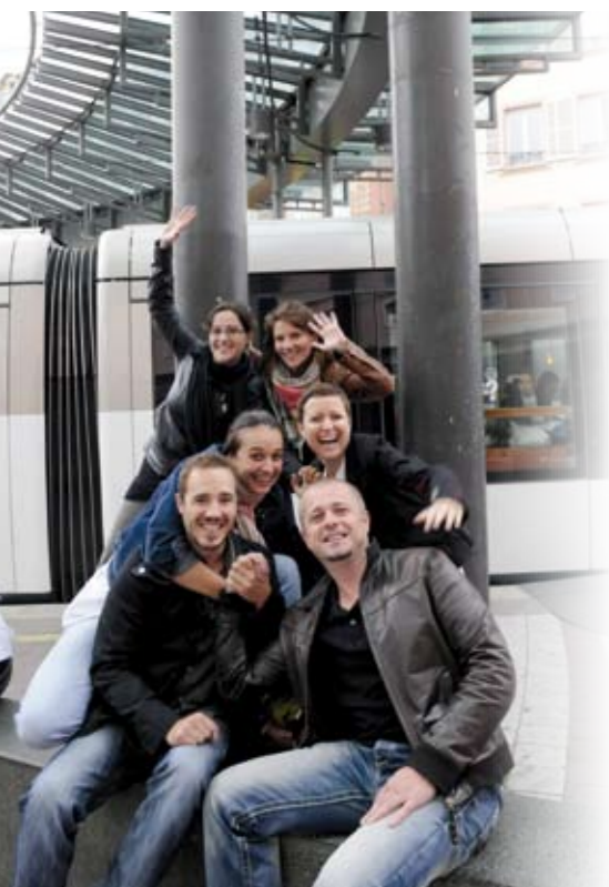
L'équipe de l'association Soundsitiv et, au fond, le tram qui sera un personnage central de sa Symphonie urbaine.