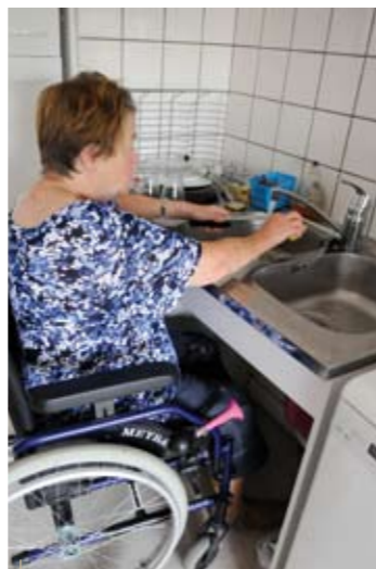
Des aménagements simples facilitent les tâches quotidiennes

* CEP-CICAT : Centre d'exposition permanent du Centre d'Information et de Conseil en Aides Techniques. L'association CICAT accompagne les personnes touchées par le handicap et les aide en proposant des solutions personnalisées. Renseignements sur www.cep.asso.fr ou au 03 88 76 16 50.