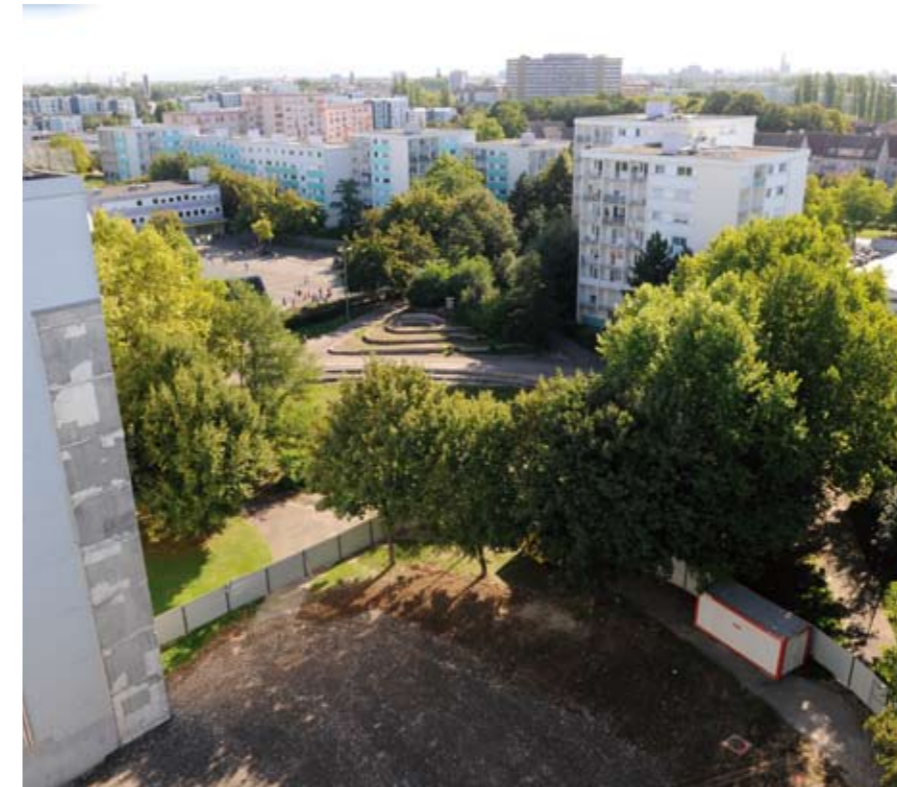
L'espace libéré par la démolition de l'immeuble 75 place Buchner permettra de créer une nouvelle voie de desserte.

L'immeuble 75 place Buchner était le premier des dix bâtiments concernés par les démolitions inscrites dans le Plan de Rénovation Urbaine (PRU) de HautePierre.