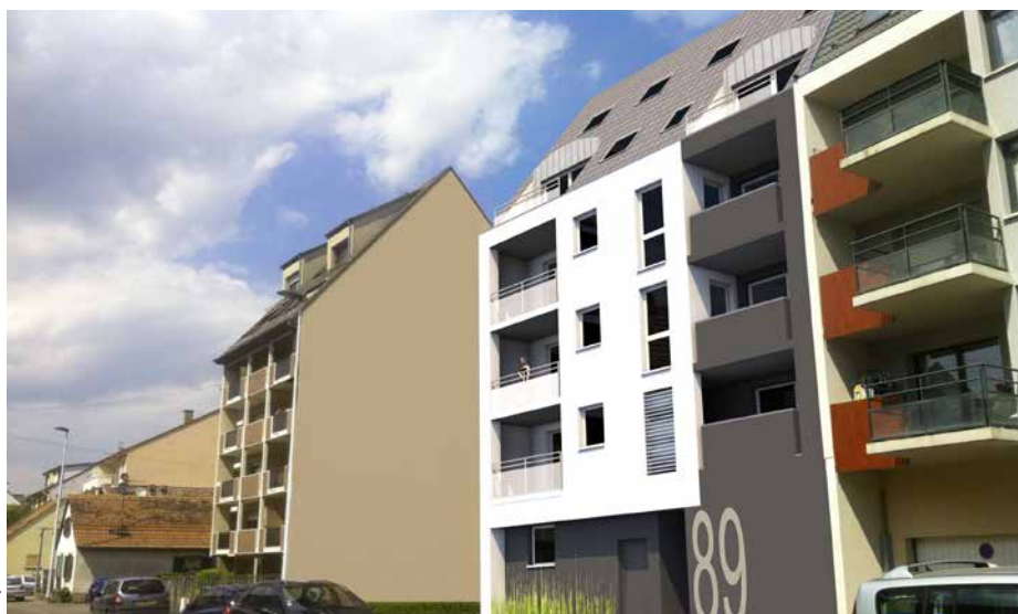
Stephan Deiss, architecte DPLC (Beinheim)

Le chantier a démarré début 2016, sur une parcelle qui jouxte une précédente réalisation de CUS Habitat, dans le quartier de l'Elsau. Le gros œuvre est aujourd'hui achevé au n°89 de la rue de l'Unterelsau, pour laisser place aux travaux d'aménagement intérieur. Au final, cette petite résidence d'architecture contemporaine proposera 10 nouveaux logements : 4 T2, 5 T3 et 1 T4, habitables à partir de mai 2017. Au-delà des prestations classiques, les résidents pourront apprécier leur balcon ou terrasse, une place de stationnement et un petit espace vert à l'arrière du bâtiment et une accessibilité par ascenseur.