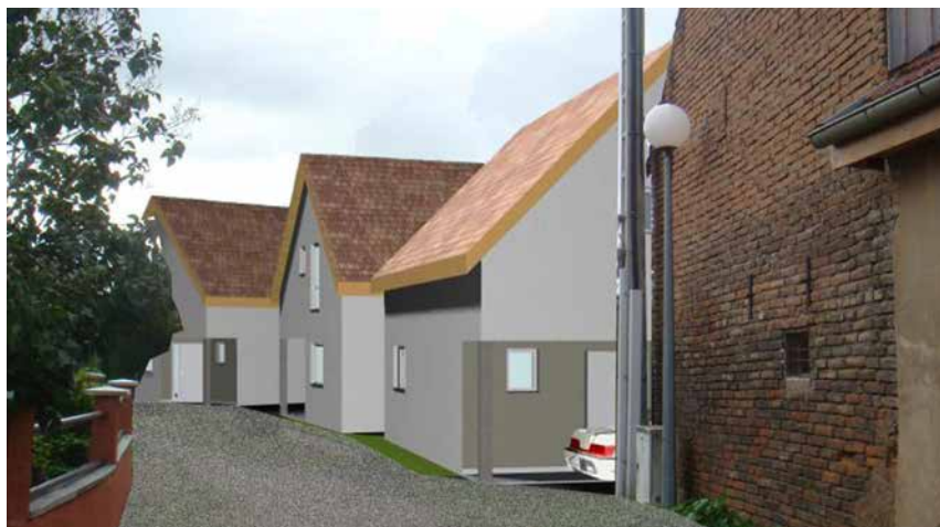
Céline ANIA-OFFENBURGER, architecte (immenheim)

CUS Habitat réalise 8 maisons individuelles, en bordure du village de Geispolsheim. Dans cette rue peu passante d'un quartier résidentiel, ce petit programme séduira ses futurs locataires par son environnement villageois et paisible. Démarrés en avril dernier, les travaux devraient s'achever en juin 2017 avec la livraison de 8 maisons de 64 à 94 m 2 : 3 T3, 3 T4 et 2 T5, tous dotés de garages individuels et de jardins privatifs. De style classique, les 8 maisons conçues sur 2 niveaux s'intégreront parfaitement dans leur cadre. Bâties en briques avec une isolation extérieure et un chauffage individuel au gaz, elles seront, en prime, économes sur le plan énergétique.