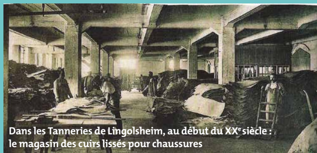
Dans les Tanneries de Lingolsheim, au début du XX e siècle : le magasin des cuirs lissés pour chaussures

Le passé industriel du site des Tanneries est indissociable de l'histoire de Lingolsheim et remonte à 1830. A cette époque, sa principale industrie fabriquait de l'amidon, du sucre et du sirop. C'est seulement au moment du rachat du site en 1889, par la famille Adler-Oppenheimer, que s'installe une usine de tannage de peaux qui fera rapidement grossir le nombre d'habitants