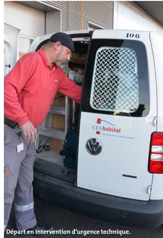
Départ en intervention d'urgence technique.

Les équipes chargées de la propreté sont également mobilisées au moment des fêtes, notamment pour dégager l'accès aux poubelles par les services de collecte municipaux. Cette année, régies et agents travailleront le 26 décembre pour le bon déroulement du ramassage du 27. Le responsable de cette équipe est également très attentif à la météo. Une alerte neige nécessite la mobilisation d'une « armée » de déneigeurs dès 5 heures du matin, pour dégager l'accès de vos entrées jusqu'aux parkings, l'accès aux locaux poubelles et saler le macadam. Une seule « opération Neige » peut nécessiter jusqu'à 6 tonnes de sel ! Là encore, une quarantaine de personnes, jardiniers compris, et les régies sont mobilisables. Au regard de l'étendue du parc de logements de CUS Habitat sur 18 communes de l'Eurométropole, leur passage requiert parfois un peu de patience et de compréhension.